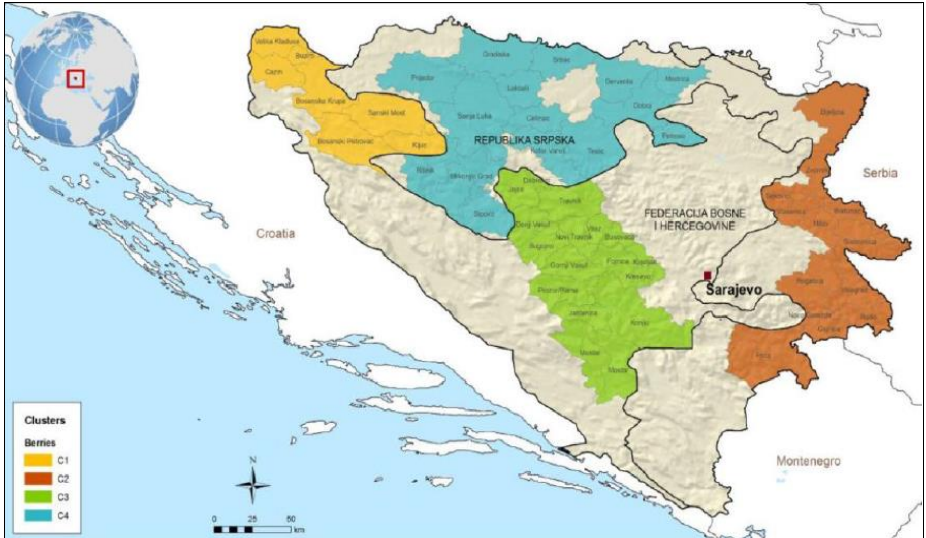
Mapa 2. Identificirana područja (klasteri) proizvodnje jagodastog voća