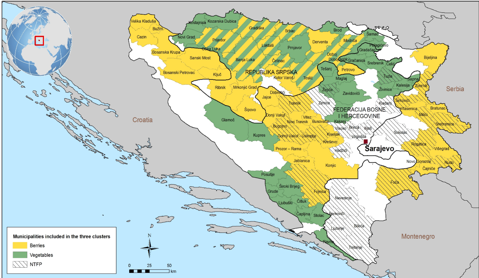
Mapa 1. Klasteri lanaca vrijednosti (podsektorski klasteri)